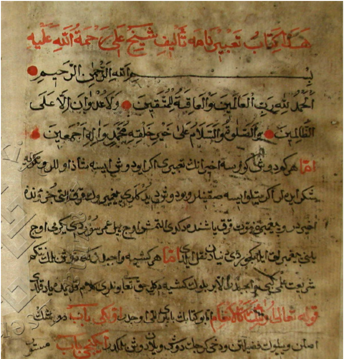
Resim 1. Yazar Şeyh Ali'nin de adının geçtiği eserin ilk sayfasından bir kısım [1b]